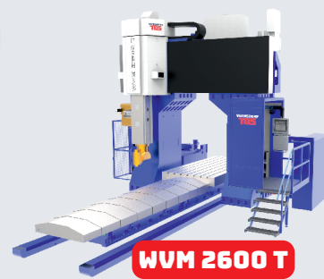
WVM 2600 T

TOS VARNSDORF a.s., Říční 1774, 407 47 Varnsdorf T: +420 412 351 203 E: info@tosvarnsdorf.cz