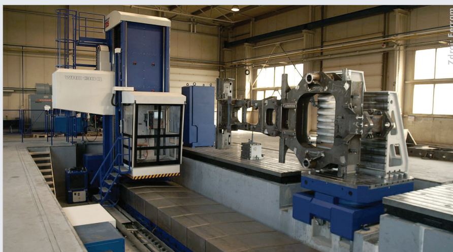
Stroj WRD 130 CNC je využíván jako reálná ukázka nadrozměrného obrábění v praxi pro nové potenciální zákazníky.

Společnost si vybudovala velké renomé v Norsku, Finsku, Německu, Francii a Velké Británii. Je úspěšná v oblasti výzkumu, vývoje a engineeringu manipulačních zařízení, které projektově navrhuje a vyvíjí již bezmála 17 let. Svou velikostí se řadí mezi střední firmy s více než stovkou kmenových zaměstnanců a obrátem přes 10 mil. eur. Silnou stránkou společnosti je vysoká přesnost a odbornost výroby a montáže, spojená se zkušeným projektovým managementem.